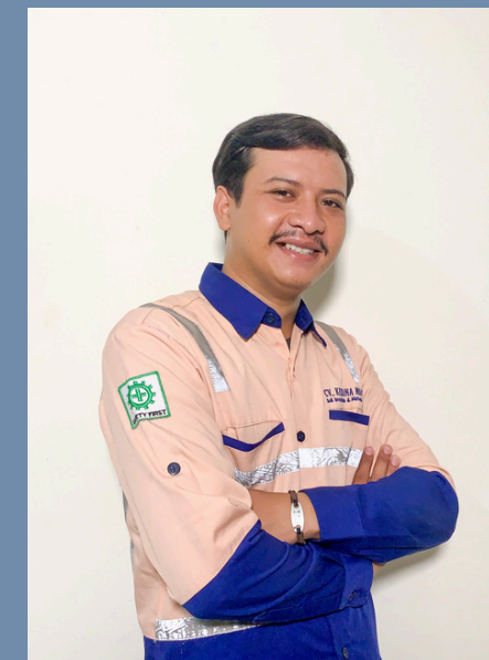
KABUL VAUZI TECHNICIAN