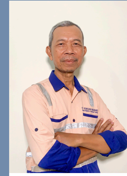
WASIMUN KEPALA LAB